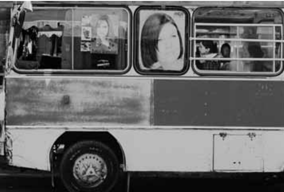
BUSSTATION IN ZAKHO