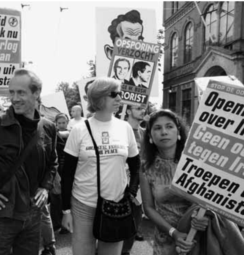
TOP VAN ONDEROP. AMSTERDAM, MEI 2007

ook vanuit andere bronnen al heel wat te zeggen over de rol van journalisten, maar dat is misschien iets voor een volgend artikel. Feit is, dat als journalisten hun werk niet kunnen of willen doen, de daadwerkelijke feiten over de oorlogshandelingen in Uruzgan via een onafhankelijk onderzoek boven tafel moeten komen. En daarop kunnen we dan ons uiteindelijk oordeel baseren of deze operatie verantwoord was.