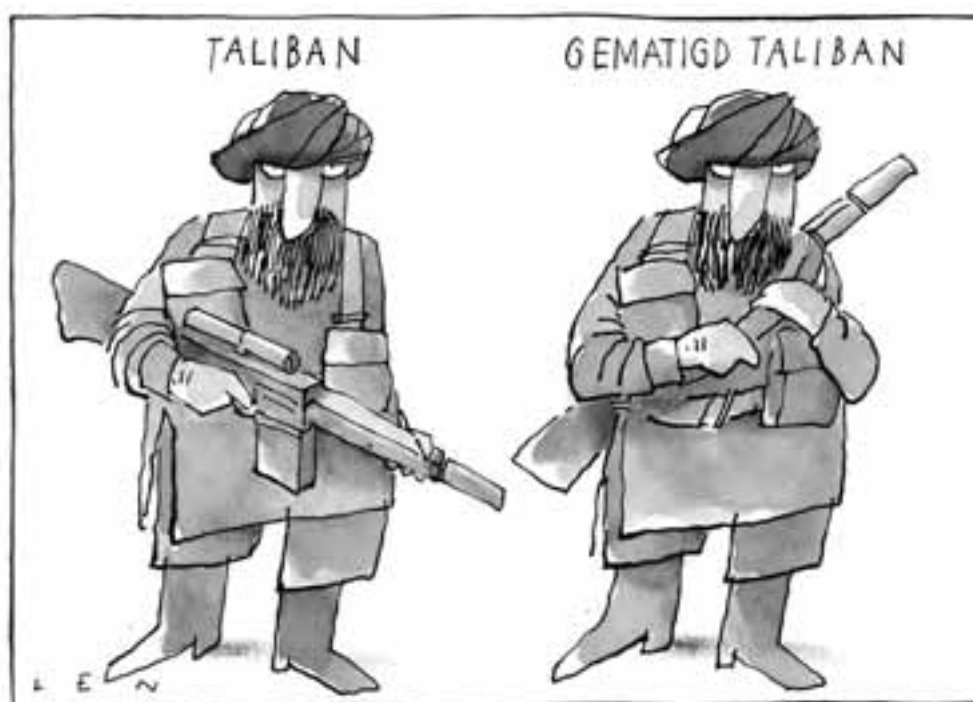
FOTO VOORPAGINA: Kraanvogels op Schiermonnikoog, juni 2010.