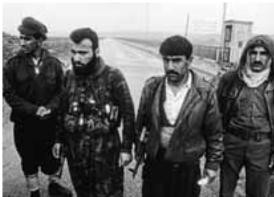
1992 KOERDEN BEWAKEN GRENSEN TUSSEN HET VRIJE GEBIED EN SADDAMS IRAK. DE TWEEDE MAN VAN LINKS SNEUVELDE KORTE TIJD LATER.

www.thekurdsofireaq.com www.michielhegener.nl