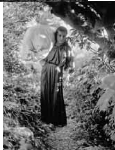
MEISJE IN BARSAN