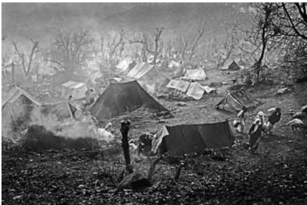
MAART 1991, IRAAKS KOERDISCHE VLUCHTELINGEN IN TURKIJE