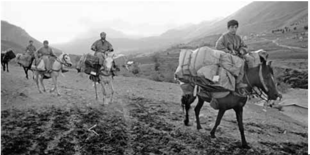
SMOKKELAARS ONDERWEG VAN IRAK NAAR IRAN, ELK PAARD BELADEN MET TWEE TELEVISIES

D e Koerden van Irak waren decennia lang synoniem met leed en ellende, maar die tijd is voorbij: nu hebben ze een de facto zelfstandige staat binnen Irak met een eigen leger en een zwaar beveiligde grens. De "Iraqi Kurdistan Region" is verreweg het veiligste en rijkste deel van Irak. Problemen zijn er ook. De sterke afhankelijkheid van import bijvoorbeeld. En, anders dan in de tijd van Saddam (1968-2003), hebben fundamentalistische moslims vrij spel. "They are penetrating every single house with no respect for freedom of expression and faith", mailde een goede vriend me eind augustus vanuit het steeds minder vrije Iraaks Koerdistan.