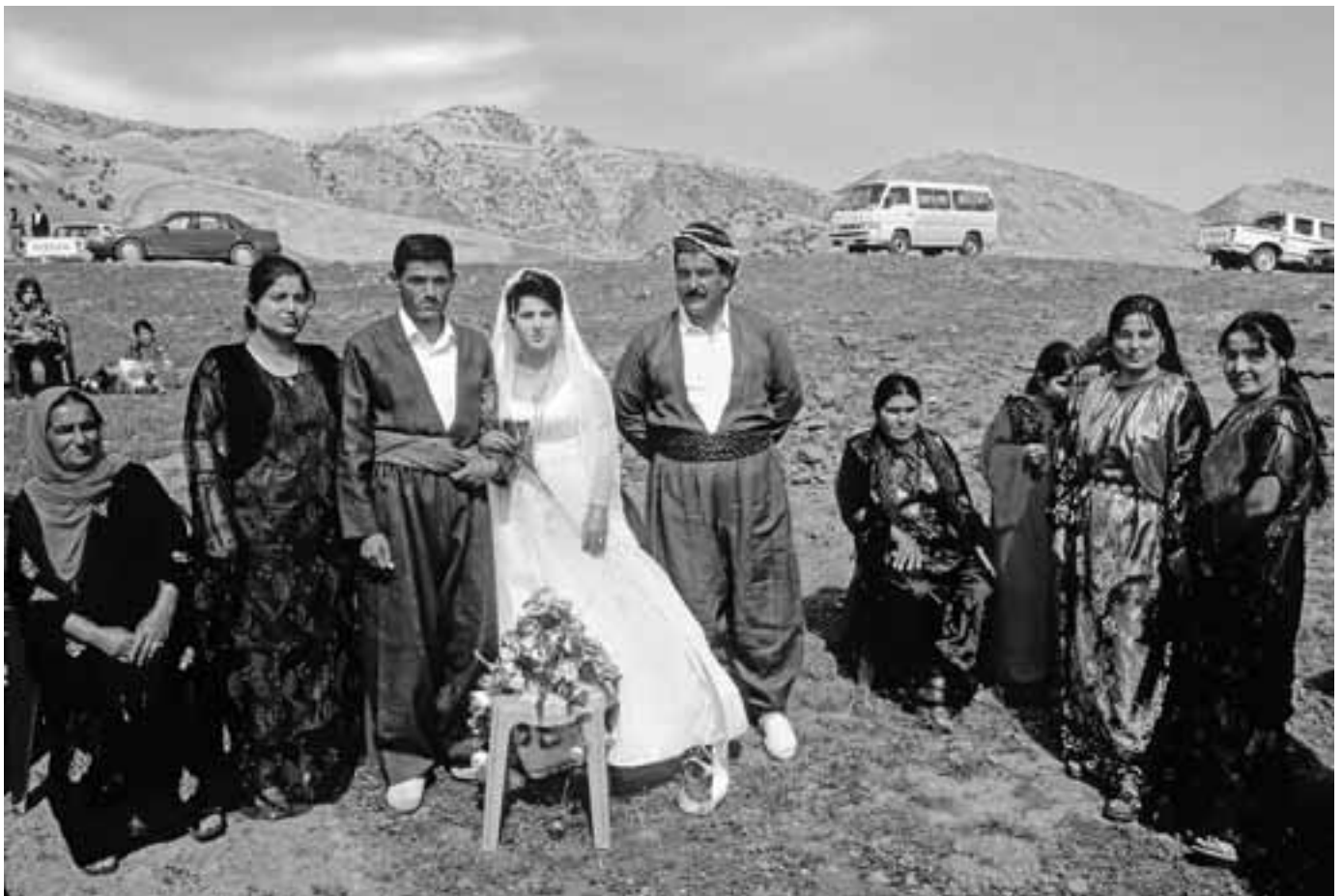
BRUILOFT IN OPEN LUCHT.