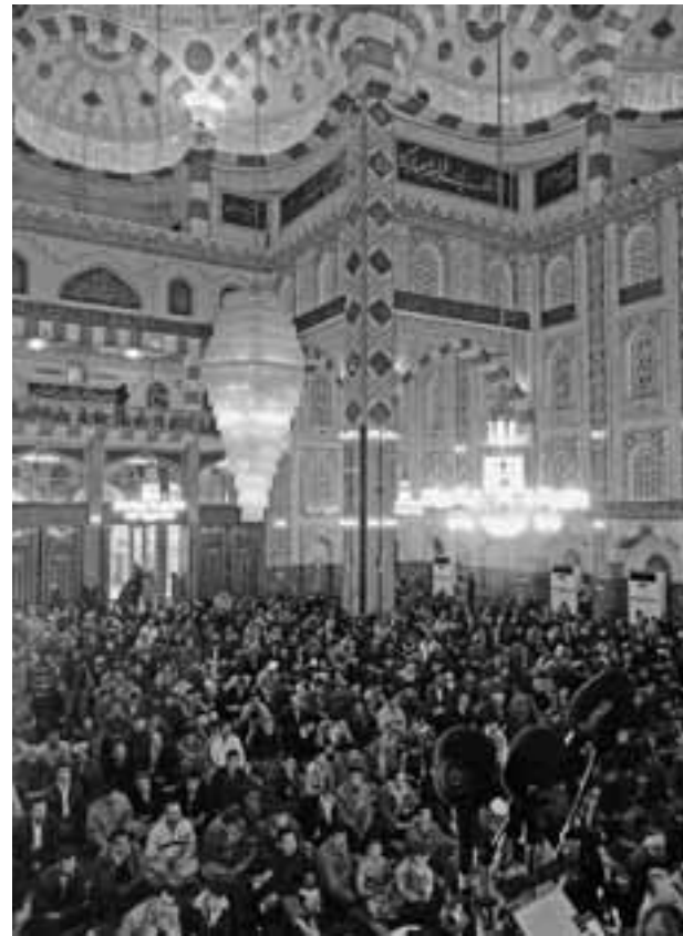
MOSKEE IN ERBIL